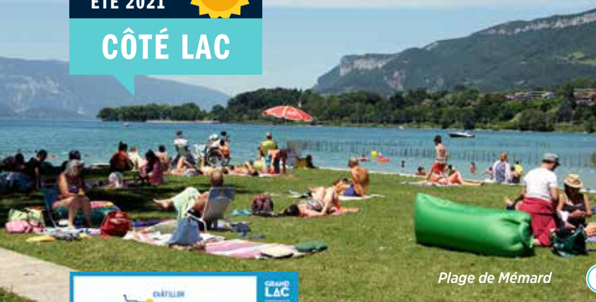
Plage de Mémard