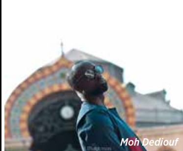
Feuilles de Roots