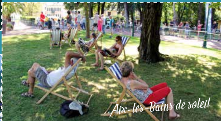
Aix-les-Bains de soleil