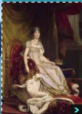
Exposition Aix l'Impériale