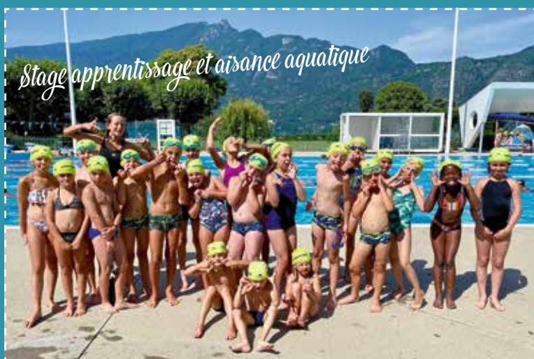
Stage apprentissage et aisance aquatique